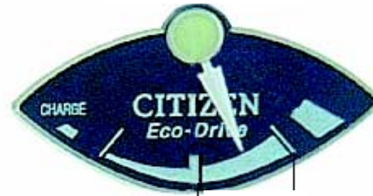
Зона уровня 2

Когда стрелка индикатора уровня зарядки находится в этой зоне, то это значит, что резерв батареи составляет 5-7 месяцев