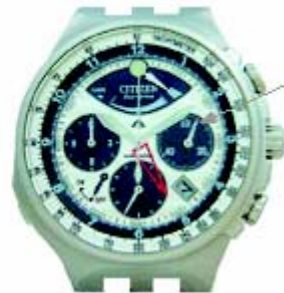
Стрелка счётчика минут Хронографа

Хронограф активируется, если сильно нажать и отпустить верхнюю правую кнопку. Хронограф можно остановить, если сильно нажать и отпустить верхнюю правую кнопку ещё раз. Для сброса хронографа после окончания отсчёта времени необходимо сильно нажать и отпустить нижнюю правую кнопку.