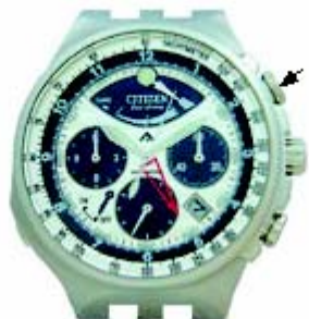
Нижняя правая кнопка