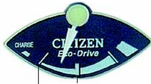
Зона уровня 1

Когда стрелка индикатора уровня зарядки находится в этой зоне, то это значит, что резерв батареи составляет 1-5 месяцев