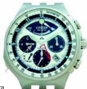
Стрелка счётчика часов Хронографа

После каждых 60 секунд отсчёта стрелка счётчика минут будет продвигаться на одну минуту. В данном примере истекло 5 минут отсчёта.