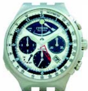
Верхняя правая кнопка

Данная модель представляет 12-часовой хронограф, который отмеряет время по 1/5 секунды.