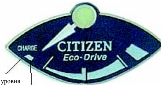
Зона уровня Charge

Когда стрелка индикатора уровня зарядки находится в этой зоне, то это значит, что резерв батареи составляет 1-7 дней