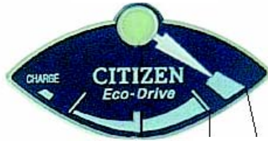
Зона уровня 3

Когда стрелка индикатора уровня зарядки находится в этой зоне, то это значит, что резерв батареи составляет 7-8 месяцев